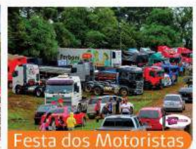
Festa dos Motoristas