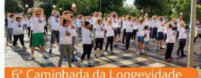
6ª Caminhada da Longevidade

Um agradecimento especial aos Presidentes que ajudaram a fazer a história da Unimed Alto da Serra: