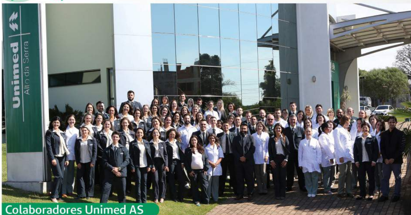
Colaboradores Unimed AS

10 anos Clínica Ambulatorial e Cirúrgica Unimed AS